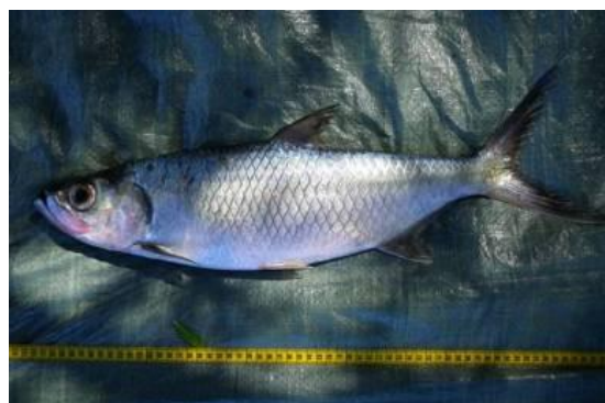
Tarpon Indo-Pacifique – Megalops Cyprinoides