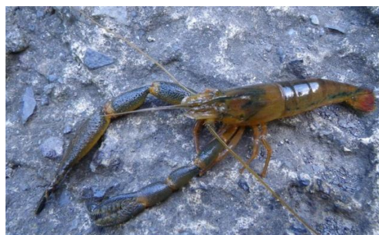
Ecrevisse – Macrobrachium lepidactylus